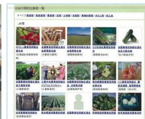
野菜契約取引マッチング・ゲート ～交流会出展者紹介サイト～