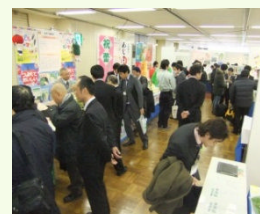
過去最高の出展者数を記録した第18回東京開催